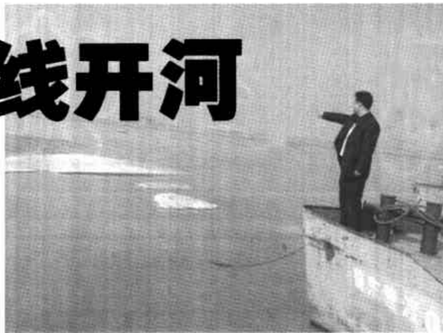
由于我市境内黄河段多弯，狭窄处较多，历史上多次发生凌汛大险，因此该段的防凌工作显得尤为重要。由于我市落实风险调度防凌预案，根据水情、凌情，合理调度各类防凌队伍及救护措施，从而在黄河出现大面积、小流量封河的情况下，下游安全度过凌汛。据了解，此次开河，标志着我市黄河防凌已安然度汛。

下游封河长度达331公里，是1981年以来封冻长度最长的一次。我市黄河此次封河总长度为108.8公里，由于本月15日至18日气温的连续回升，未出现骤然降温天气，黄河于18日上午9 00正式平稳“文开河”。