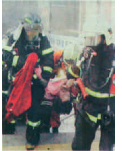
2月18日，韩国大邱市地铁发生火灾，营救人员正从地铁口抬出一具遇难者尸体。据报道，该起火灾造成100多人伤亡。

望。近年来，我市城市发展很快，规划建设管理水平不断提高，但有的地方环境脏乱差，有的行业卫生不达标，有的企业仍存在污染问题，对此群众反映比较强烈。深入开展“双创”工作，认真解决好人民群众普遍关心的污染和脏乱差等问题，不断改善人民群众赖以生存的环境，逐步提高生活质量和健康水平，是非常必要的。（记者 薄文军）