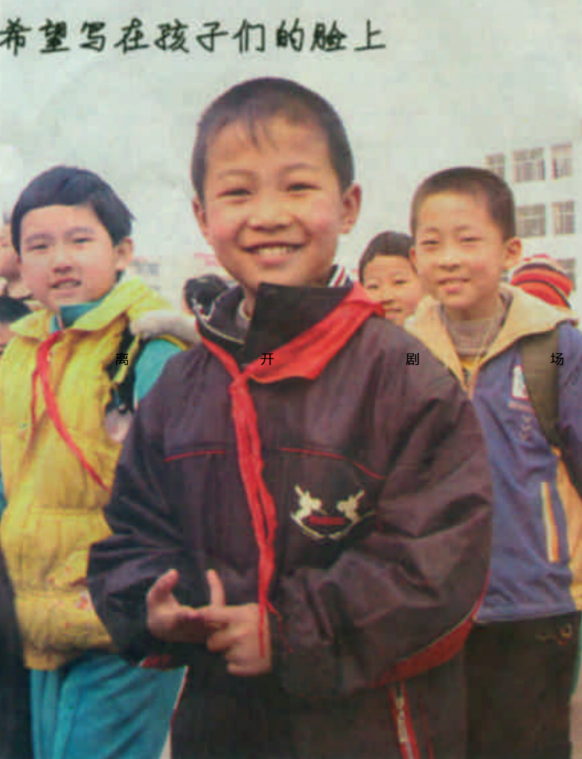
希望写在孩子们的脸上

地等脏乱差的治理，搞好城区车辆乱停乱放、乱摆摊设点和乱设户外广告、门牌等的治理，搞好“四小”行业卫生专项治理，搞好环境卫生治理。对现在已经达标的方面，也要强化措施，巩固提高，确保不出现滑坡。（记者 薄文军 通讯员 孙万禄 曲健）