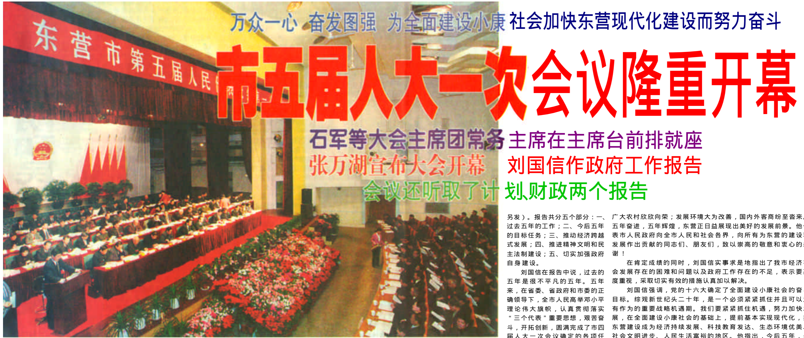
本报2月19日讯 今天上午，东营市第五届人民代表大会第一次会议在黄河影院隆重开幕。

这次大会，是在全市上下深入学习贯彻党的十六大精神，为实现全面建设小康社会，提前基本实现现代化的宏伟目标而努力奋斗的关键时期召开的一次重要会议，是全市人民政治生活中的一件大事。大会将听取和审议市人大常委会和“一府两院”的工作报告，审查和批准我市国民经济和社会发展计划及财政预算；选举产生我市新一届政权领导班子和我市出席山东省第十届人民代表大会的代表。