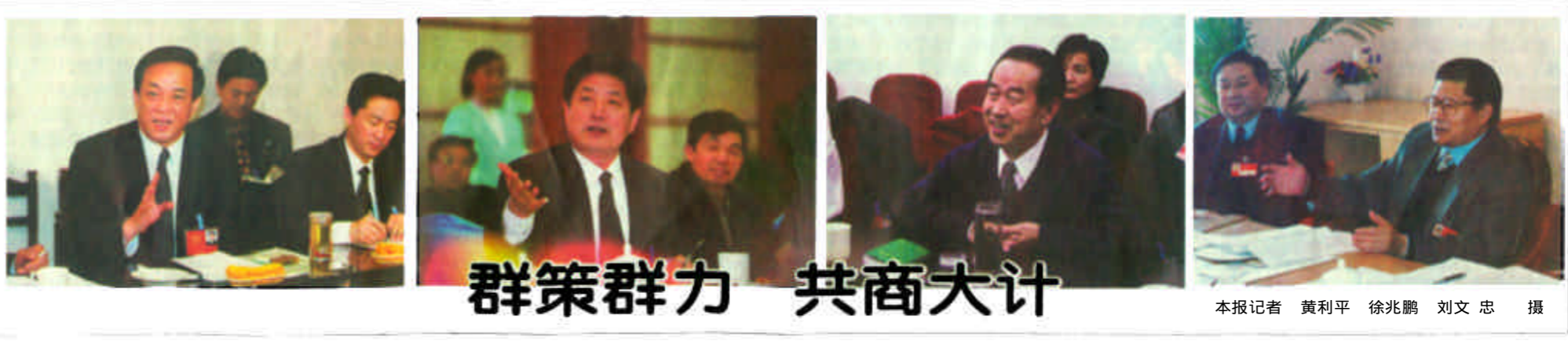
群策群力 共商大计